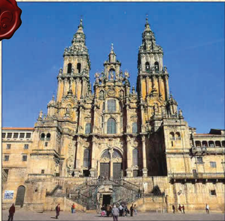
Arquitectura clasicista.

En la literatura el arte barroco se puede identificar con el abundante uso de la metáfora y la alegoría. En la arquitectura la podemos ver desarrollada en su gran mayoría en Europa desde el inicio del siglo XVII hasta dos tercios del siglo XVIII, en esta última etapa se conoce como arte Rococó